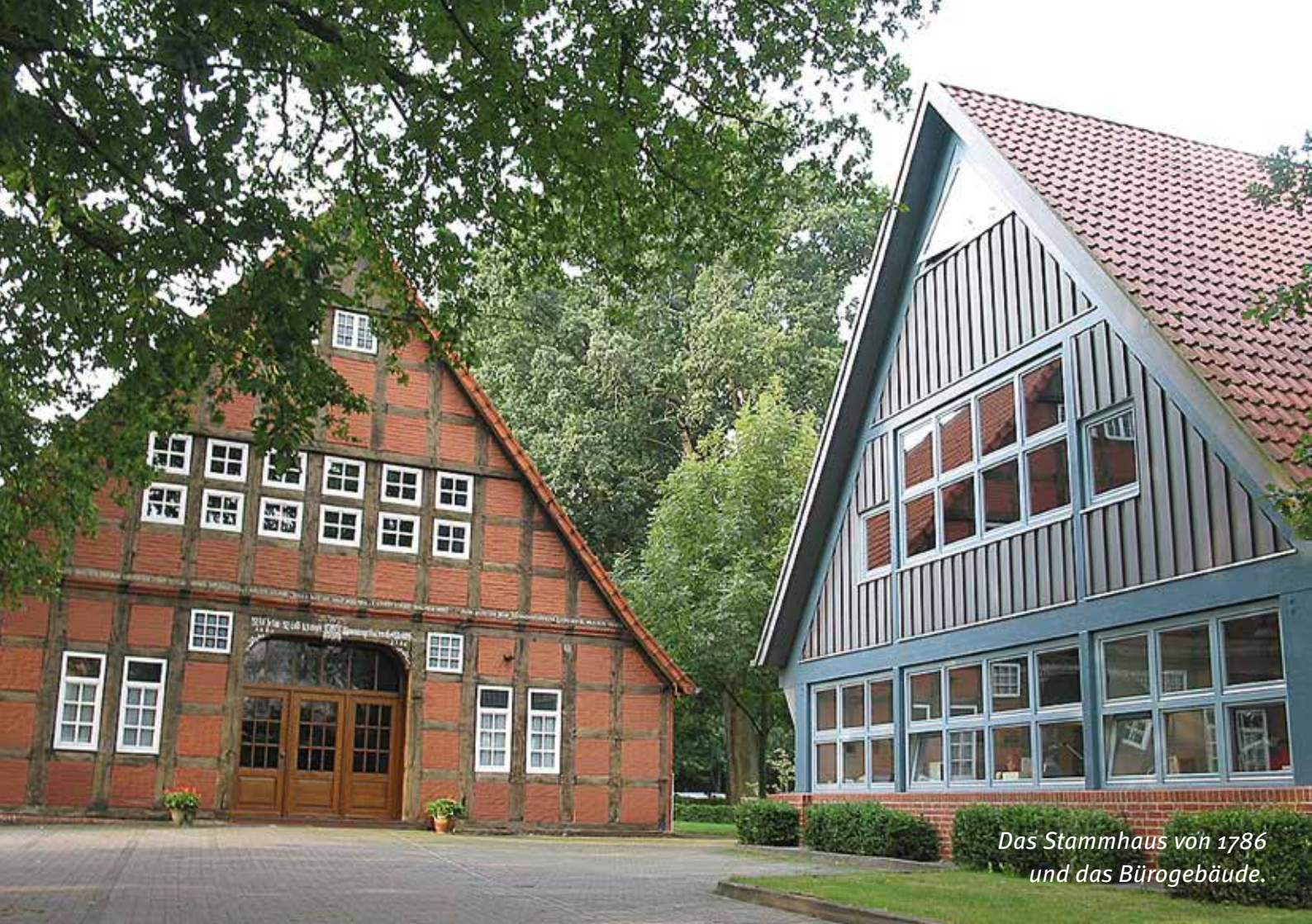
Das Stammhaus von 1786 und das Bürogebäude.